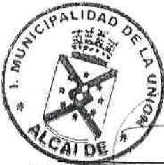
ALDO RODRIGO PINUER SOLIS ALCALDE I.MUNICIPALIDAD DE LA UNIÓN