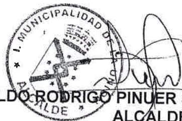
ALDO RODRIGO PINUER SOLIS ALCALDE